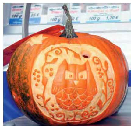
Der Siegerkürbis der Klasse 2B der Grundschule am Paradies.

stellt wurden. Die Marktkunden hatten jetzt die Aufgabe, den Siegerkürbis zu wählen. Gar nicht so einfach bei der großen Auswahl an verschiedenen Schnitzereien. "Ach hier sind auch noch Kürbisse? Sind die aber toll geworden!", staunten die vielen Besucher. Als Belohnung für die Bewertung gab es einen Präsentkorb randvoll mit frischen