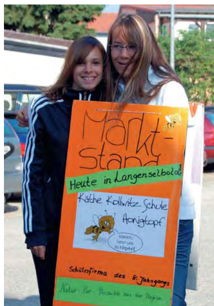
Werbung ist wichtig — auch für den Wochenmarktstand der Schülerfirma.

Beim Wochenmarkt konnten dann alle Marktbesucher die Tiere bestaunen und für die Kinder gab es einen weiteren Höhepunkt: Ausgestattet mit den grünen DMG-Einkaufstaschen und Marktgutscheinen durften sie selbst einkaufen.