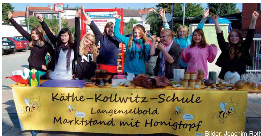
Mit Spaß und Engagement auf dem Wochenmarkt — die Schülerfirma einer 8. Klasse.

Sogar der Radiosender HR4 berichtete in der Sendereihe „Markttag“ vom Langenselbolder Jubiläum. Dieser Bericht ist als mp3-Datei auf der Homepage der Deutschen Marktgilde im Bereich Presse/Presseartikel abrufbar.