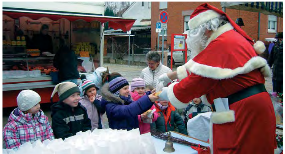
Der Nikolaus ist in diesen Tagen auch auf den Wochenmärkten — gerade bei den jungen Besuchern — ein gerne gesehener Gast, hat er doch meist kleine Geschenke für sie dabei.