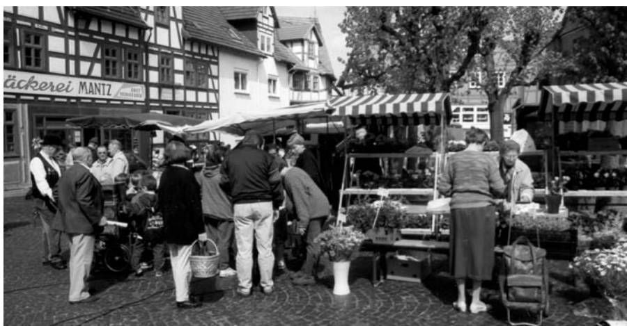
Neukirchen zeigt sich von der besten Seite.

Unsere Standorte: S. 8 Wichtige Adressen für Sie