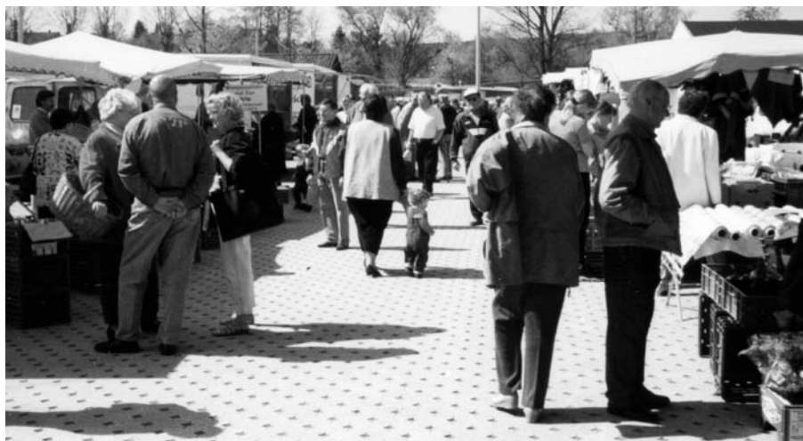
Schon am ersten Markttag kamen die Solmser in Scharen auf den neuen Marktplatz.