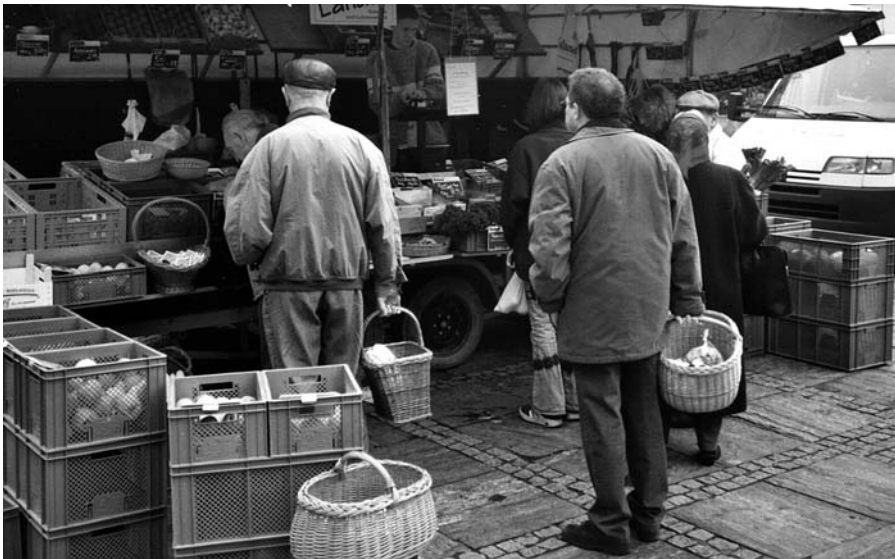
Der Neckarsulmer Wochenmarkt ist stark gewachsen.