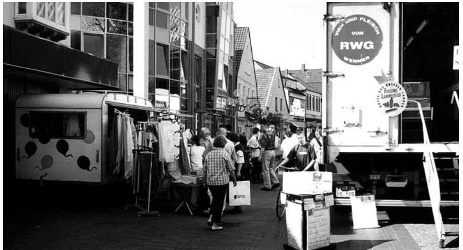
Der Wochenmarkt bringt mehr “Leben” in die Fußgängerzone von Cloppenburg.

“Der Wochenmarkt soll dazu beitragen wieder etwas mehr Leben und damit auch Kunden in die Innenstadt zu bringen. Die Kunden des