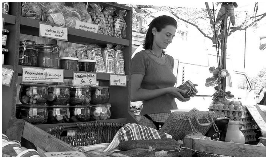
Bioprodukte gehören auch in Garbsen zum Sortiment.

schon unter der Regie der Stadt nach Recht und Ordnung geschaut. Mit einem Imbiß, biologisch angebauten Produkten, Tee, Kräutern, Gewürzen und Pflanzen ist das Sortiment sinnvoll ergänzt worden. Im Internet ist Garbsen unter http://www.garbsen.de vertreten.