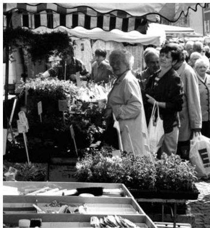
Großer Andrang bei der Gärtnerei Knorr.

onspieler dazu. Ein Moderator stellte die Händler mit ihren Produkten den Marktkunden vor. Für die Damen gab es Rosen, ein Clown unterhielt die kleinen Marktbesucher mit allerlei Klamauk und bastelten verschiedene Tiere aus Luftballons, Händler stellten ihre Produkte für Verlosungen zur Verfügung und