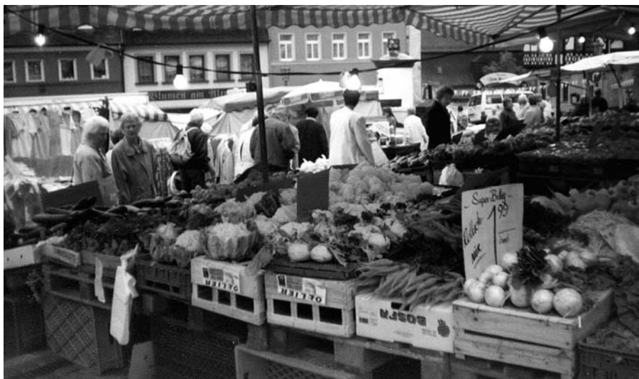
Das Marktfest in Hohenstein-Ernstthal lockte viele Besucher an.