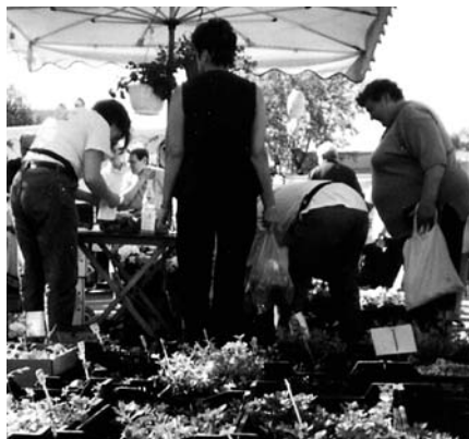
Das Marktfest in Flöha mit dem Stand der Gärtnerei Franke.

onspieler dazu. Ein Moderator stellte die Händler mit ihren Produkten den Marktkunden vor. Für die Damen gab es Rosen, ein Clown unterhielt die kleinen Marktbesucher mit allerlei Klamauk und bastelten verschiedene Tiere aus Luftballons, Händler stellten ihre Produkte für Verlosungen zur Verfügung und