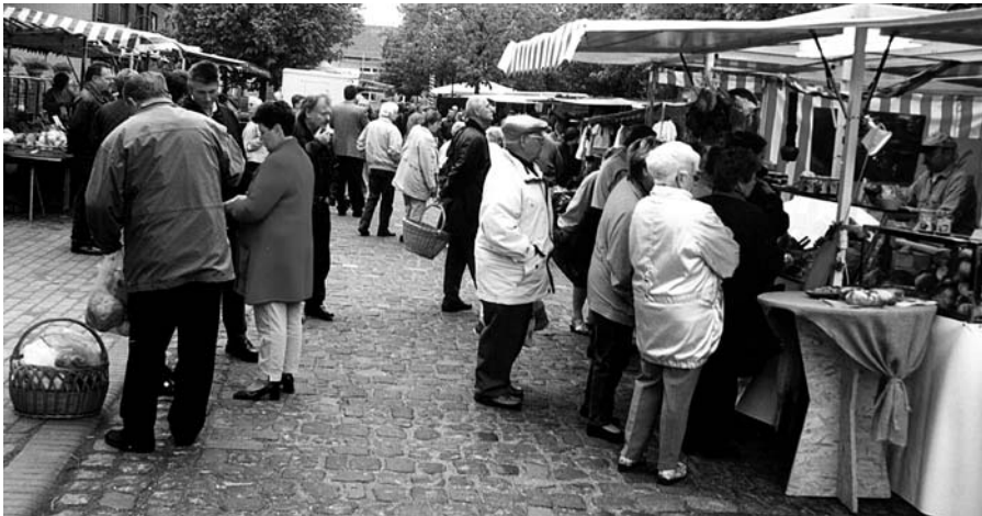
Wieder gut belebt, der neue Wochenmarkt in Rommerskirchen nach der Übernahme durch die DMG.

Kürtens sehr informative Internetseite ist unter der Adresse http://www.kuernten.de zu finden.