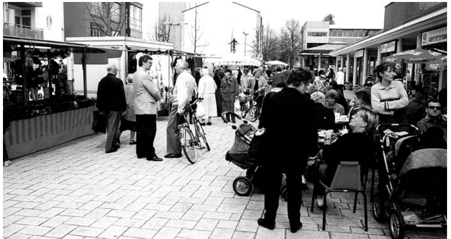
Eine gute Integration von Wochenmarkt und stationärem Einzelhandel.

Im Internet sind viele Informationen unter http://www.neckarsulm.de zu finden.