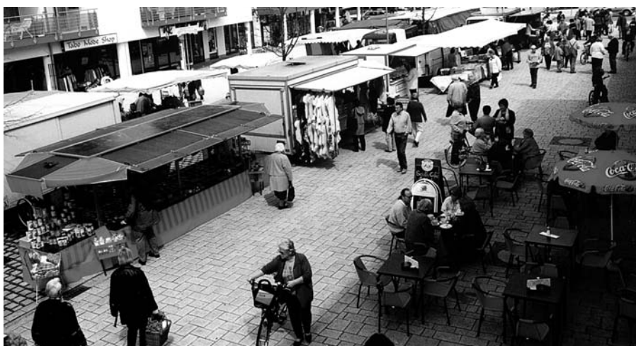
Neufahrn als Muster: Einzelhandel profitiert vom Wochenmarkt.