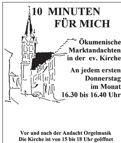
Handzettel für die Marktandacht