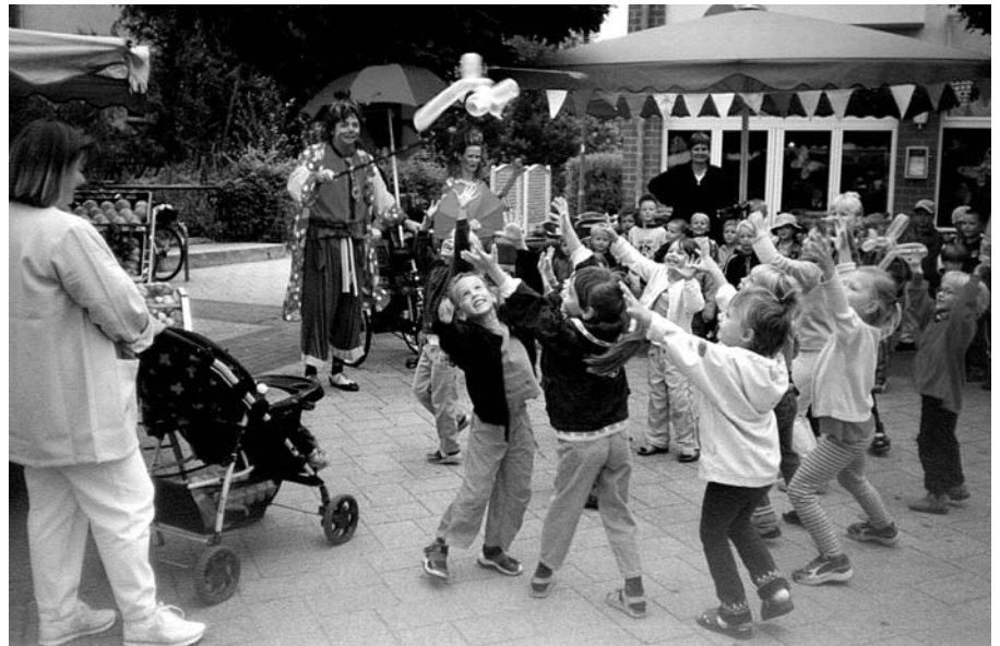
Der Clown Dudel-Lumpi aus Hönow verbreitete bei den jüngsten Marktbesuchern mit seinen Luftballontieren ausgelassene Stimmung.

Die alte Weisheit "Werbung kostet Geld, keine Werbung aber kostet Kunden" ist weithin bekannt, dementsprechend sorgt die DMG Marktgilde e.G. regelmäßig für Aufmerksamkeit durch verschiedene Aktionen rund um den Wochenmarkt. Sehr beliebt bei Händlern und Kunden sind Marktfeste, können hierbei doch mit geringem Aufwand für die Händler viele Kunden auf den Wochenmarkt gelockt werden. Die Organisation und Koordination der einzelnen Aktionen eines Marktfestes wird von der Marktgilde übernommen. Die Händler ihrerseits sind aufgerufen, mit Besonderen Preisangeboten, Probiermöglichkeiten oder speziellen Produkten auf sich aufmerksam zu machen. Dabei hat es jeder Händler selbst in der Hand, seinen Kunden etwas besonderes zu bieten; der "Rahmen" dazu wird von der DMG, in der Regel gegen eine geringe Kostenbeteiligung, komplett übernommen. Am 29. August war es in der Ofenstadt Velten soweit. Die DMG-Zweigniederlassung in Limbach-Oberfrohna hatte die Händler auf dem dortigen Wochenmarkt schon zwei Monate vorher über das ge-