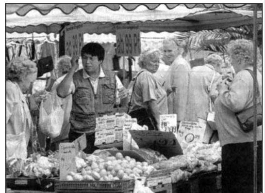
Blick auf den Glauchauer Wochenmarkt. Die Atmosphäre ist es, die viele Kunden immer wieder anzieht.