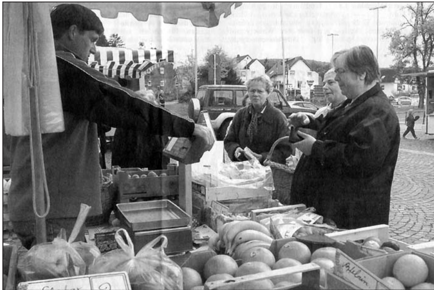
Frisches Obst und Gemüse macht den Hahner Markt für die Kunden attraktiv.