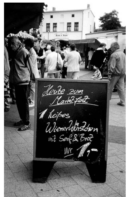
Mit vielfältigen Angeboten beteiligten sich die Markthändler am Marktfest.