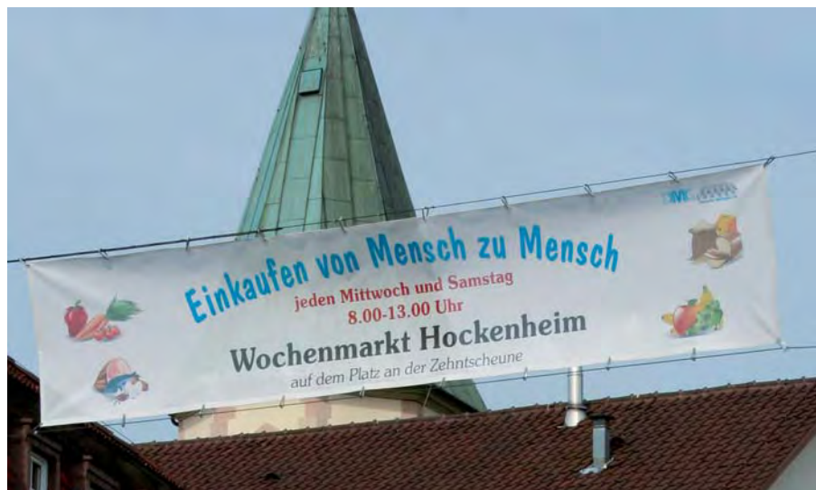
In bester Zusammenarbeit mit der Stadt Hockenheim entstanden: Wochenmarktwerbung in luftiger Höhe — praktisch und wirkungsvoll.