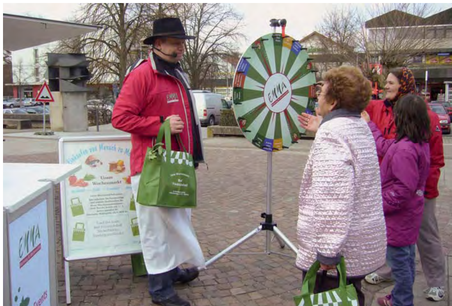
Einmal am neuen Glücksrad drehen und einen Gutschein erhalten, das nutzen die Kunden gerne. Aber auch die robusten neuen DMG-Einkaufstaschen waren auf dem Markt in Bad Friedrichshall begehrt.