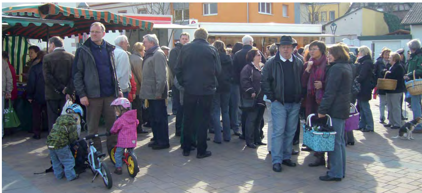
Einkaufserlebnis für die ganze Familie — einen solchen Andrang wie hier auf dem Platz an der Zehntscheune wünschen sich alle, denen der Wochenmarkt am Herzen liegt.