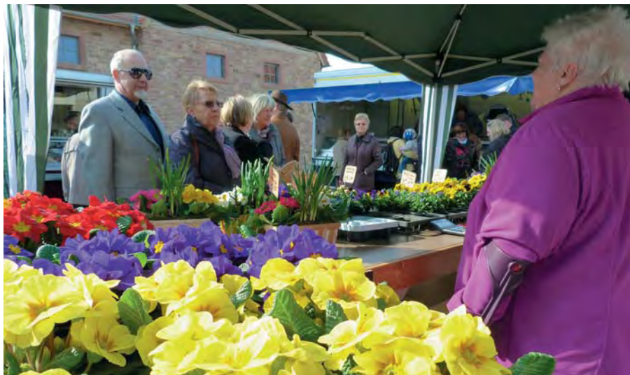
Das Frühjahr — mit seiner bunten Vielfalt — hat auch auf den Wochenmärkten deutlich sichtbar Eingang gehalten.