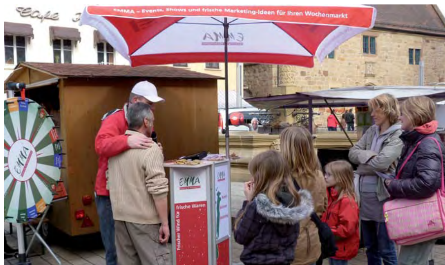
Ein Blickfang und sehr nützliches Arbeitsmittel, die neue "Mobile Moderationsbühne" der EMMA GmbH. Hier in Neckarsulm bei der Vorstellung eines Händlers und seines Sortiments, natürlich mit der Möglichkeit, sofort zu probieren.

mobile Moderationsbühne auf, stellte das große Glücksrad daneben, bekam die ersten Probierportionen von den Händlern, die er vorstellen wollte, und war sofort von neugierigen Marktbesuchern umlagert. "Das Lampenfieber, das ich vor dieser neuen Aufgabe hatte, war schnell verflogen, denn die Marktbesucher kamen freundlich auf mich zu und freuten sich über die Gutscheine für ihren Einkauf", resümiert er.