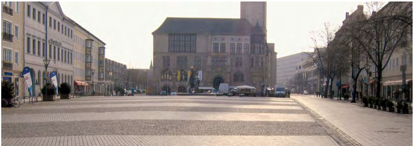
Ein moderner Marktplatz in bester Lage — aber nur noch wenige Händler und somit auch kaum Kunden. In Dessau hat diese "Abwärtsspirale" extreme Auswirkungen auf den Markthandel.